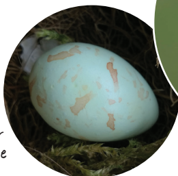
Oeuf du verdier d'Europe